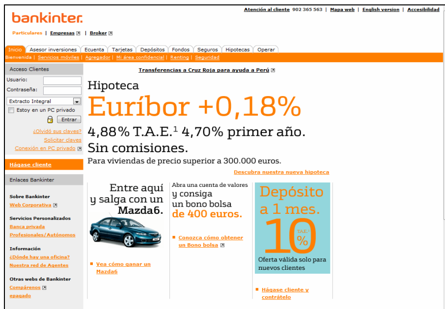
Imagen 1.- El portal eBankinter presenta la mayor subida porcentual: 51 puntos.